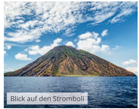
Blick auf den Stromboli