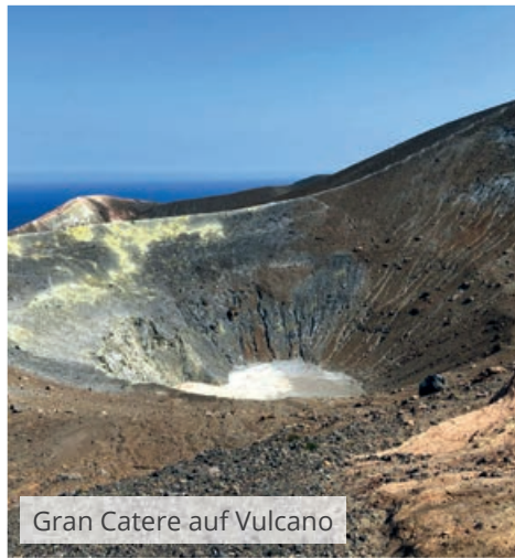
Gran Catere auf Vulcano