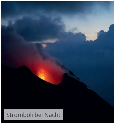
Stromboli bei Nacht