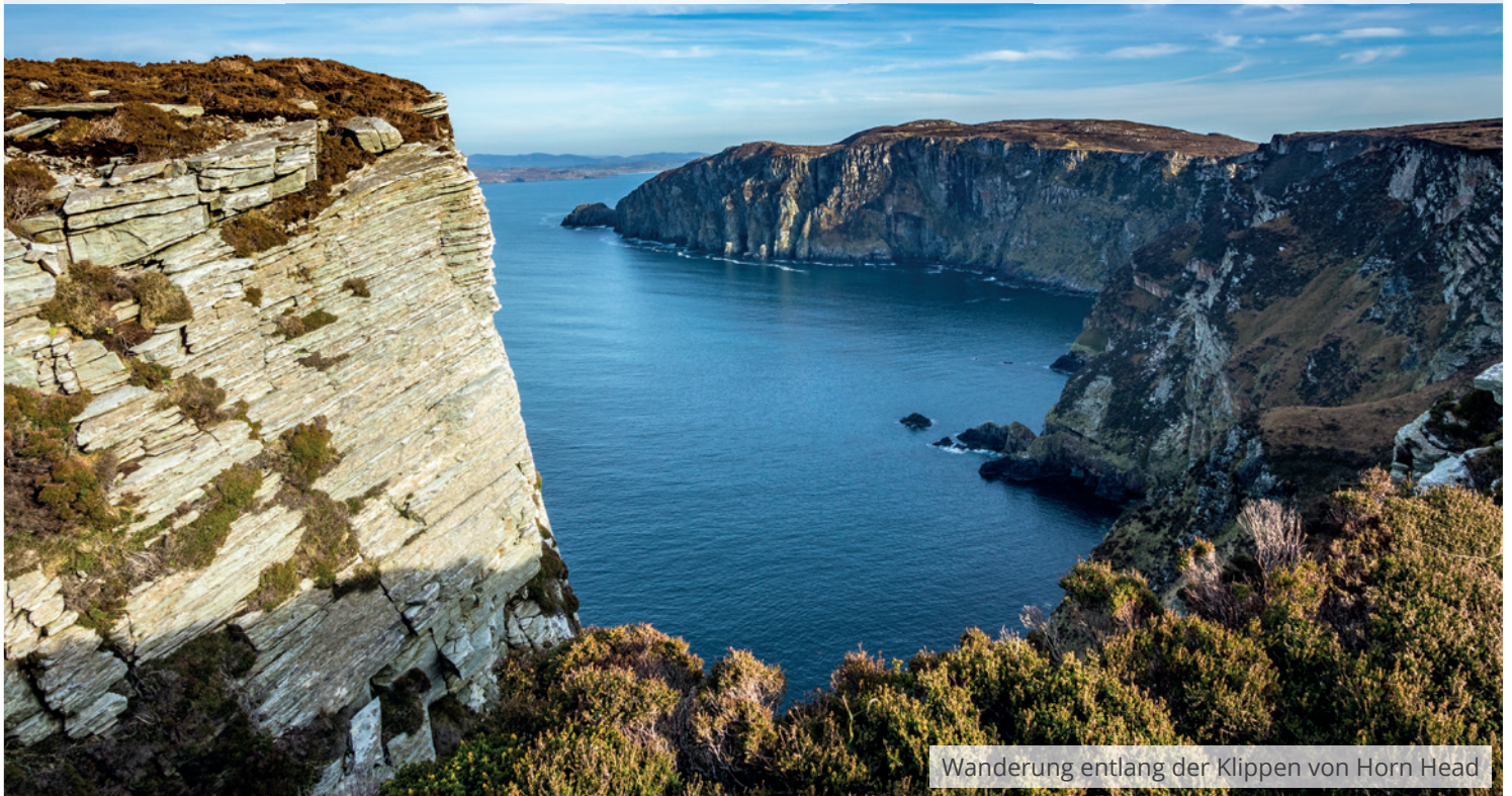
Wanderung entlang der Klippen von Horn Head