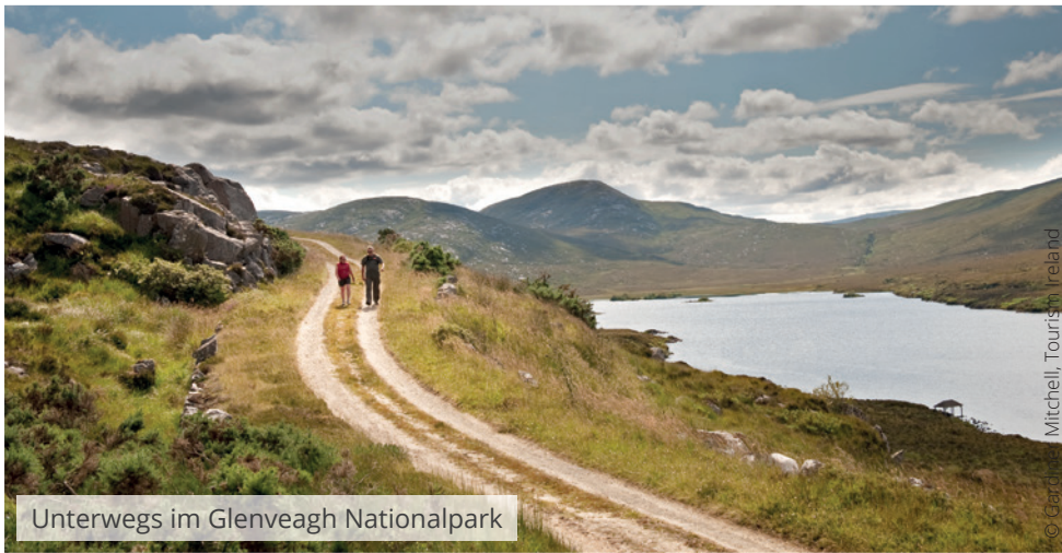
Unterwegs im Glenveagh Nationalpark