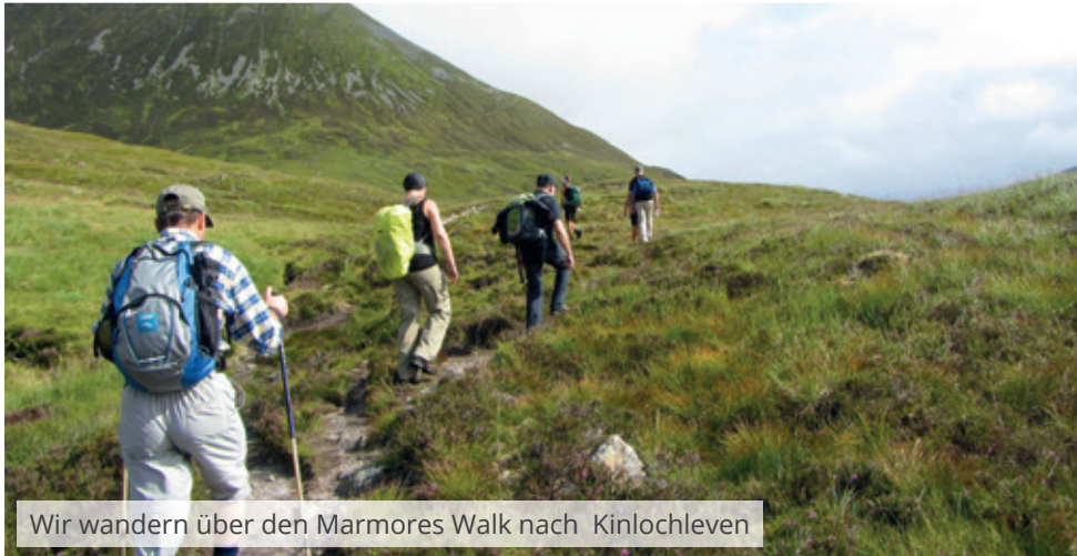
Wir wandern über den Marmores Walk nach Kinlochleven