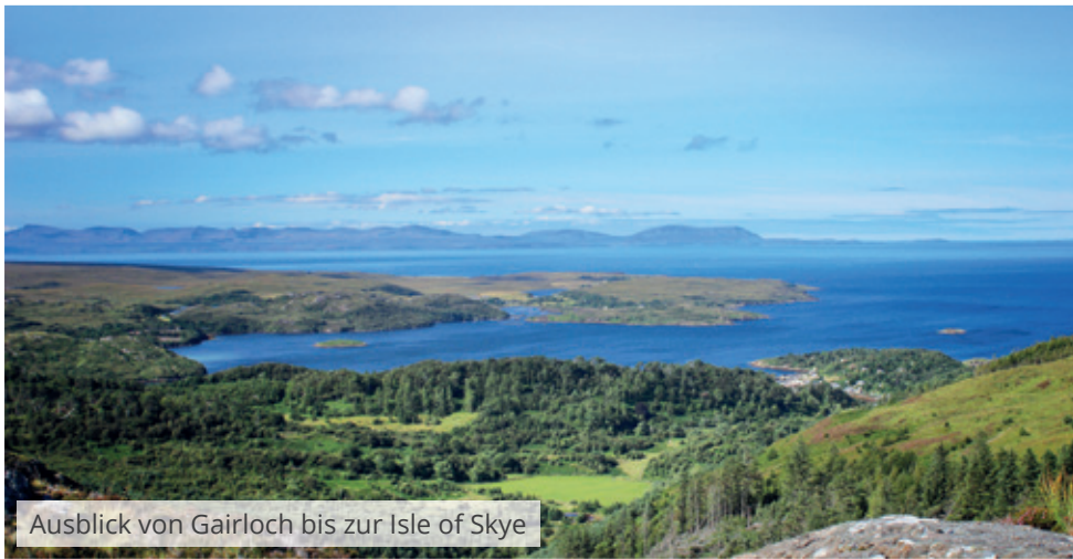
Ausblick von Gairloch bis zur Isle of Skye